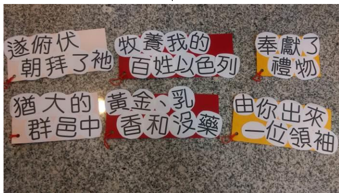
( 字句的前端可打動並套上橡皮筋，方便活動使用 )