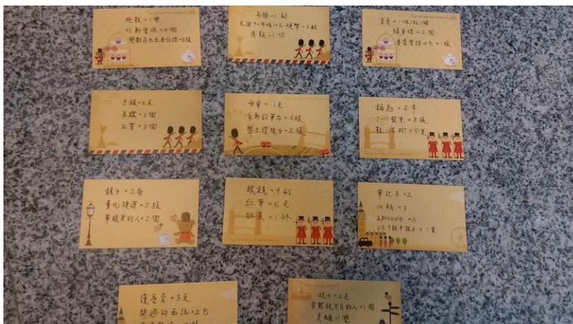
( 題目可自行更改 )