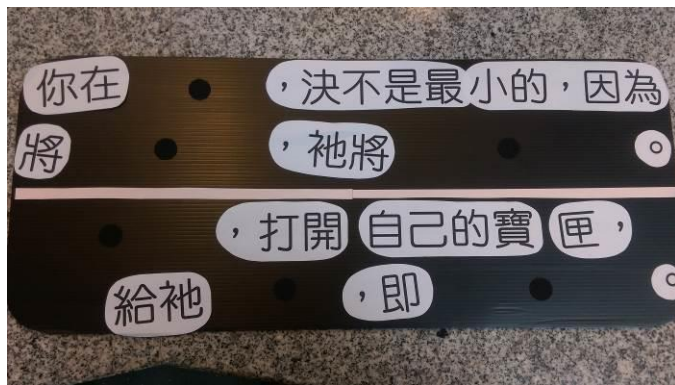
( 經文裡的段落可以自行挑選 )