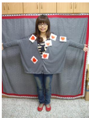
主題四教學遊戲道具成品照