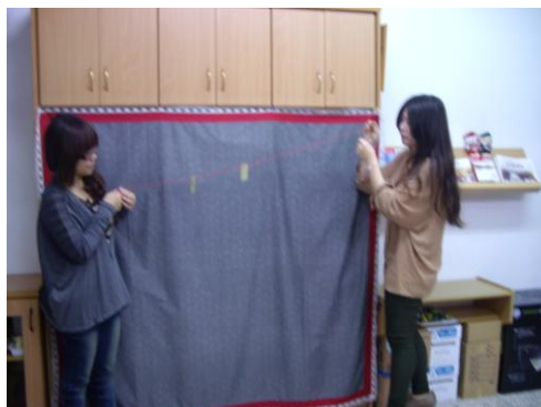
主題五教學遊戲道具成品照