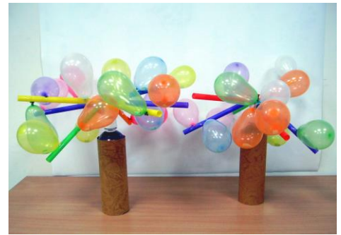
主題二教學遊戲道具成品照