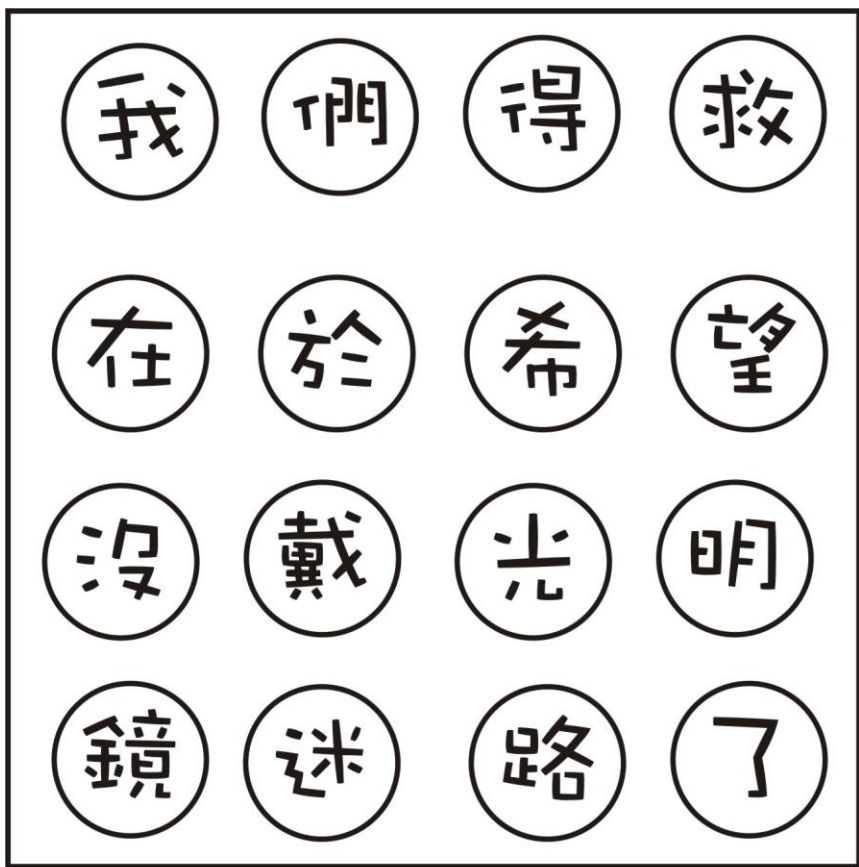
主題一教學遊戲道具成品照